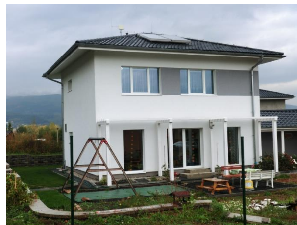
Pasivní dům v Teplicích